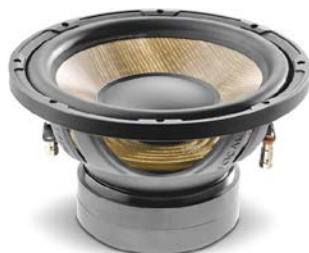
250mmサブウーファー / P 25 FE