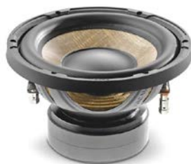
200mmサブウーファー / P 20 FE