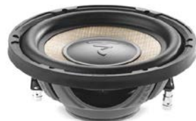
200mmサブウーファー / P 20 FSE