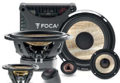
165mm3ウェイ・コンポーネントキット / PS 165 F3E