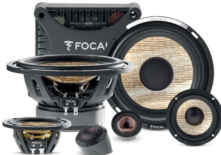
<新製品> FOCAL 「FLAX EVO」シリーズ (写真は165mm3ウェイ・コンポーネントキット「PS 165 F3E」)

フォーカル・オーディオ・ジャパン株式会社(本社:千葉県木更津市、代表取締役:中島 敏晴)は、フランス FOCAL(フォーカル)社製カースピーカーの中核モデル＝FLAX(フラックス)シリーズを全面改良した新製品「FLAX EVO」(フラックス エボ)シリーズ 全10機種を、6月11日より全国のフォーカル プラグ&プレイ ストア、ならびにFOCAL Car Audio製品取扱販売店で発売いたします。