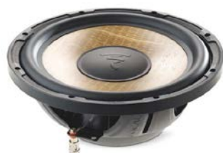
250mmサブウーファー / P 25 FSE