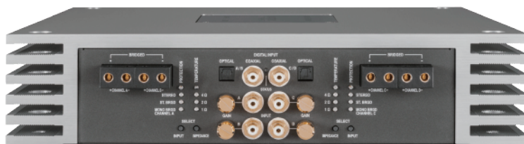
入出力端子側サイドパネル

肉厚なアルミ製ヒートシンク、24金メッキ非磁性体接続端子、キャパシター専用端子はMX4を継承しています。