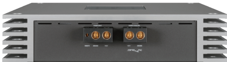
電源・キャパシタ端子側サイドパネル